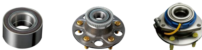
本公司第一、二、三代汽车轮毂轴承单元图示

截至目前，公司已累计开发各类型号的汽车轮毂轴承单元近4,000种，覆盖了世界上包括奔驰、宝马、奥迪、福特、通用、克莱斯勒、大众、本田、丰田、标致等在内的主要中高档乘用车、商用车的车系车型。