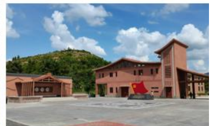
▲ 广东佛山·高明区杨和镇大布村乡村振兴示范村建设项目 (EPC)