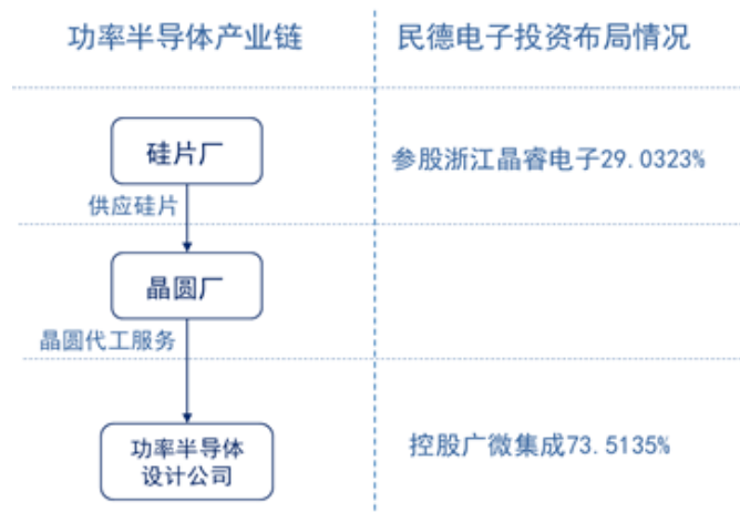
图1 公司在功率半导体产业链布局情况

2020年6月，公司完成对广微集成技术（深圳）有限公司73.5135%股权收购，正式进入功率半导体设计行业；2020年7月，公司增资参股浙江晶睿电子科技有限公司29.0323%股权，布局功率半导体硅片行业。公司目前在功率半导体产业链布局情况如下图示：