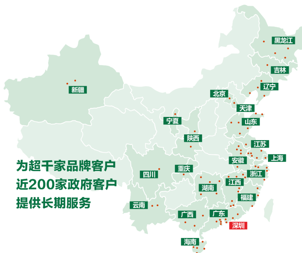
示图1：公司市政环卫和物业清洁业务全国分布图

公司先后通过了ISO9001质量管理体系认证、ISO14001环境管理体系认证、OHSAS18001职业健康安全管理体系认证。拥有深圳市环卫清洁服务企业环卫作业清洁服务甲级等级证书、公共设施维护能力甲级等级证书和城市生活垃圾经营性清扫、收集、运输服务许可证、道路运输经营许可证，具备中国清洁清洗行业国家一级资质、有害生物防治服务资质等专业资质。公司现为中国城市环境卫生协会常务理事单位。公司先后参与编制由中国城市环境卫生协会的《保洁员职业技能标准》、《背街小巷清扫保洁作业规程》、《道路及附属设施机械清洗作业规程》、《农村垃圾分类设施设置标准》。