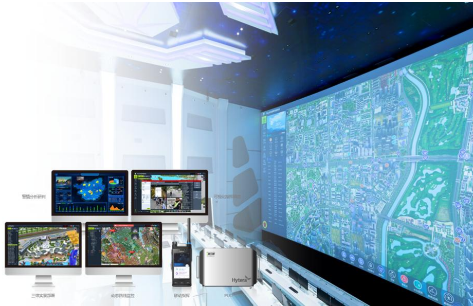
指挥调度平台产品族

在应急通信领域，公司推出了一系列现场应急解决方案，包括窄带自组网产品、宽带自组网产品、手提应急指挥箱、应急指挥业务平台等，成为消防救援、林业防火、电力巡检、自然灾害救援等场景中音视频指挥调度保障的重要支撑手段，具有快速部署、多融合联动指挥、公专融合、宽窄融合等特点。