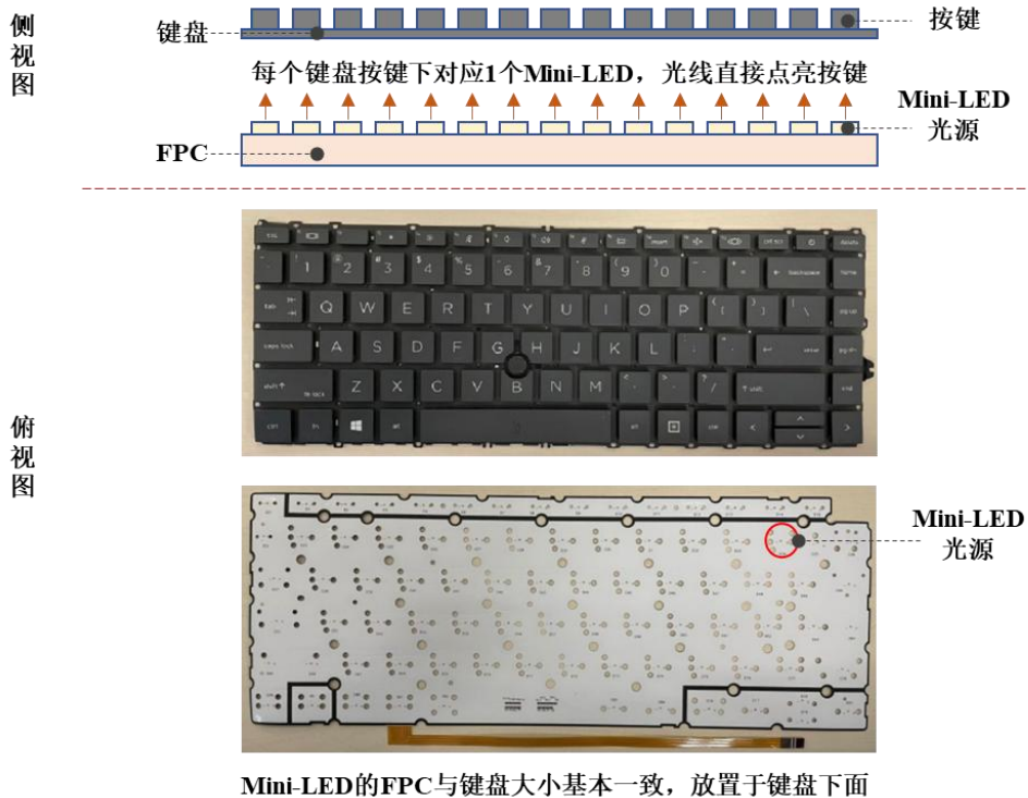
图：笔记本电脑键盘 Mini-LED 背光模组原理示意图

当前，市场上大多数笔记本电脑发光键盘采用传统 LED 背光模组发光，即通过“LED+导光板”方式为键盘提供光线。未来随着 Mini-LED 技术成熟以及成本的降低，其在背光显示效果、散热性能、降低背光键盘厚度、减少耗电量等方面均优于传统 LED，亦将会在高端的笔记本电脑机型上应用。无论未来笔记本电脑采用上述哪种方式，FPC 由于其可弯折、轻薄、电路性能稳定等特点，满足了笔记本电脑轻薄化、长续航、性能稳定等发展趋势，因此未来 FPC 仍然持续应用于背光模组，保证了 FPC 产品在笔记本电脑背光应用领域的市场需求稳定。