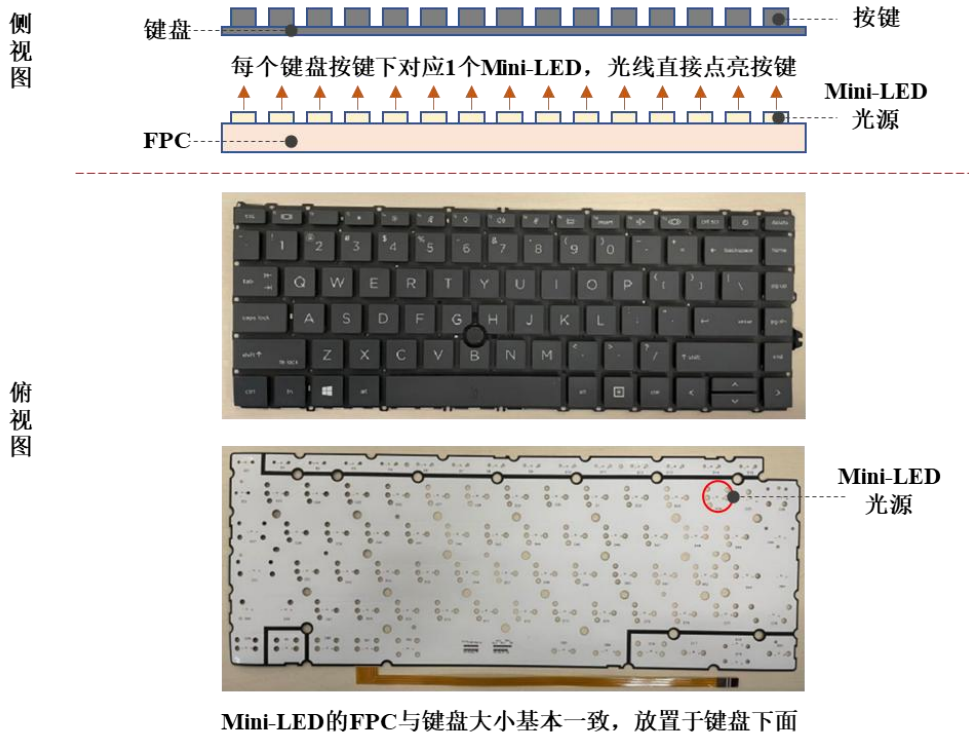
图：笔记本电脑键盘 Mini-LED 背光模组原理示意图

当前，市场上大多数笔记本电脑发光键盘采用传统 LED 背光模组发光，即通过“LED+导光板”方式为键盘提供光线。未来随着 Mini-LED 技术成熟以及成本的降低，其在背光显示效果、散热性能、降低背光键盘厚度、减少耗电量等方面均优于传统 LED，亦将会在高端的笔记本电脑机型上应用。无论未来笔记本电脑采用上述哪种方式，FPC 由于其可弯折、轻薄、电路性能稳定等特点，满足了笔记本电脑轻薄化、长续航、性能稳定等发展趋势，因此未来 FPC 仍然持续应用于背光模组，保证了 FPC 产品在笔记本电脑背光应用领域的市场需求稳定。