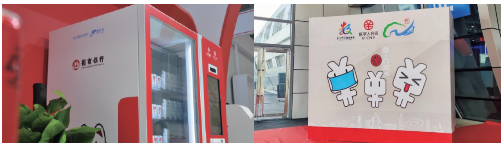
楚天龙助力多家运营机构打造展会现场“数字人民币”体验场景

作为数字人民币产业联盟、数字金融创新产业联盟成员单位，楚天龙将紧密携手产业联盟各方，共同致力于数字人民币产业发展，探索“数字人民币+”发展方向，加大数字人民币试点应用推广与普及力度，助力数字中国建设，使数字人民币融入绿色低碳循环发展经济体系，推动我国经济社会绿色低碳转型。