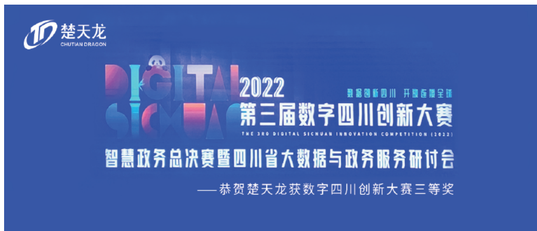
第三届数字四川创新大赛

结合基层政务窗口办公的需求，公司自主研发落地信创版本多功能办公一体机，为多个省市相关项目提供自主品牌证卡打印机、便携式制卡机及相关技术支持与服务。报告期内，公司研发设计的数字人民币多功能自助终端获得“第十一届省长杯工业设计大赛”优秀奖；“社保惠民服务全领域一卡通解决方案”“社保惠民服务全领域一卡通解决方案”被赛迪网评为“2022年度智慧人社优秀解决方案”、“政务智能审批平台解决方案”被赛迪网评为“2022年度智能审批优秀解决方案”，并在“第三届数字四川创新大赛”评选活动中荣获三等奖。