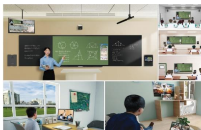
“三个课堂”解决方案