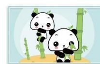
鸿合幼教交互软件