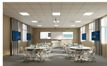
高职教互动教学解决方案