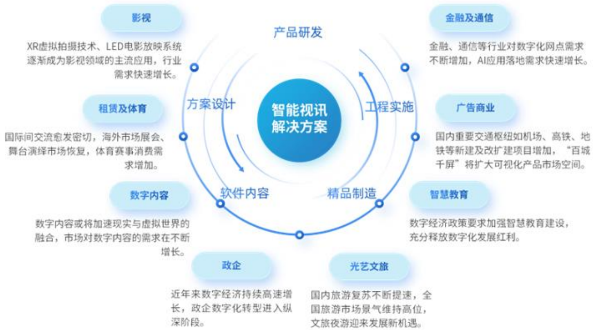
公司智能视讯业务模式及业绩驱动因素

公司采用直销及渠道销售相结合的销售模式，为客户提供方案设计、产品研发、精品制造、软件及内容定制、工程实施于一体的全流程解决方案及服务。