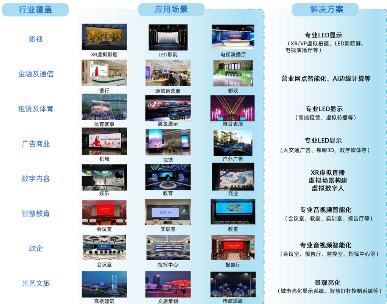
公司智能视讯业务应用领域

多年来，公司始终深耕行业，专精特新，目前解决方案已覆盖影视、金融及通信、租赁及体育、广告商业、数字内容、智慧教育、政企、光艺文旅等细分行业，并持续以客户为导向，精准把握客户差异化需求，持续完善产品矩阵，为更多的行业客户提供专业的智能视讯解决方案及服务。