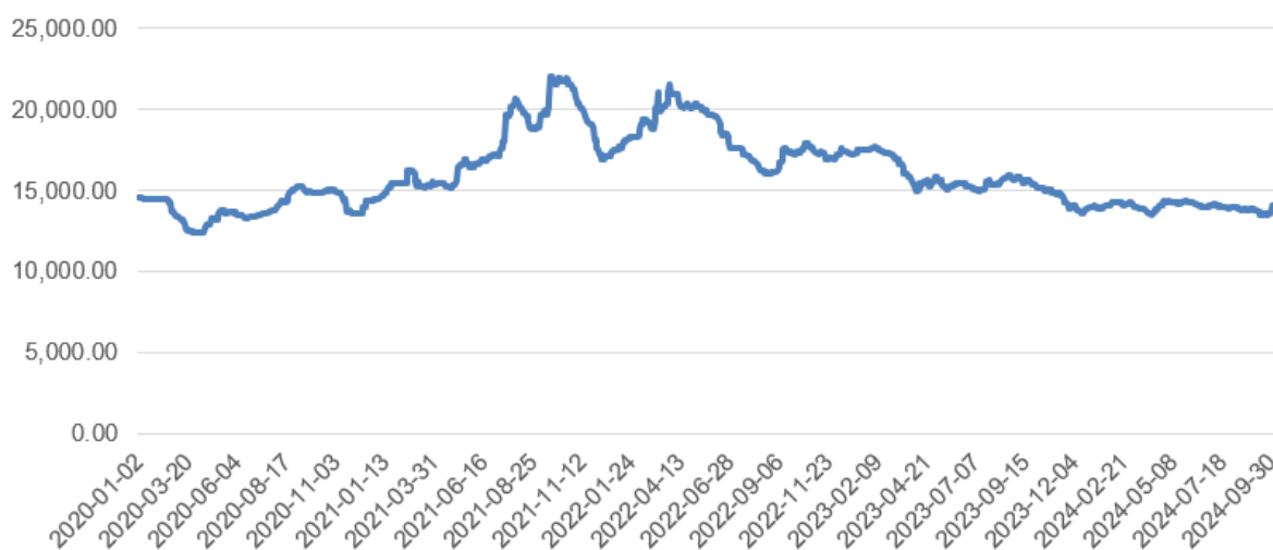
现货价:不锈钢, 元/吨