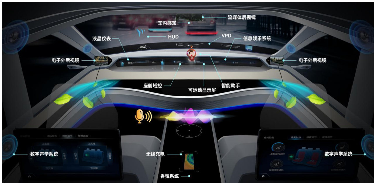
公司汽车电子业务智能座舱产品应用场景示意图

在智能座舱领域，公司聚焦用户体验与价值创造，构建了从底层软件到上层应用，从核心硬件到全栈开发的配套能力。持续迭代升级智能座舱解决方案，实现多产品融合协同发展，并通过搭载 AI 大模型，创新多模态交互体验，精准服务用户需求。