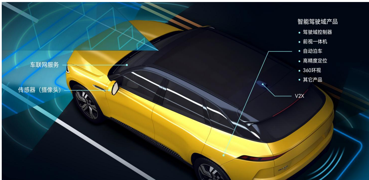
公司汽车电子业务智能驾驶及网联产品应用场景示意图

在智能驾驶领域，公司依托高性能计算平台、多传感器融合及智能驾驶算法，构建从低速泊车场景向高速领航的全场景智能驾驶能力，提供人-车-路-云协同的智能驾驶解决方案，为用户提供更安全便捷的智驾体验。