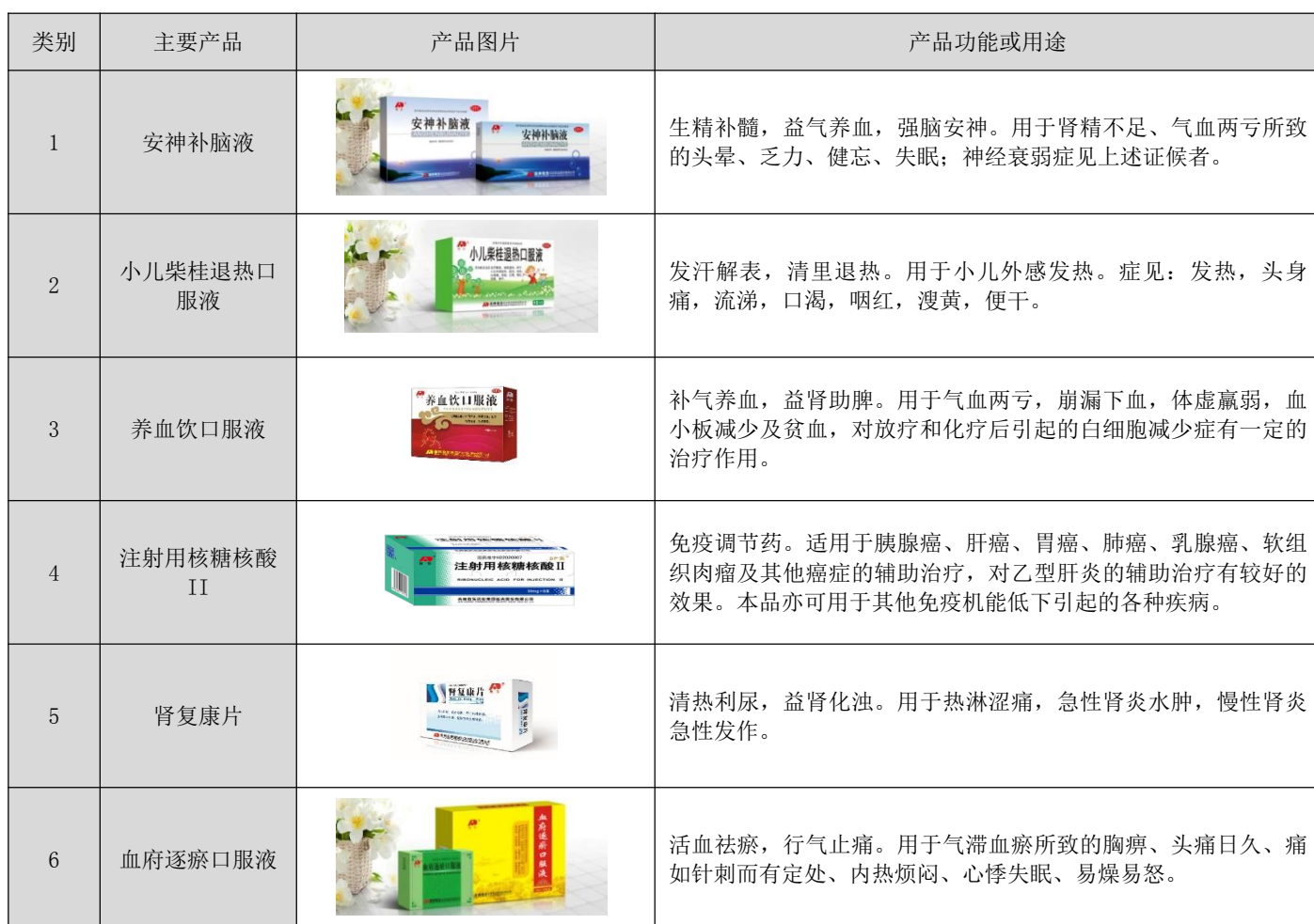
表 2. 公司主要产品目录