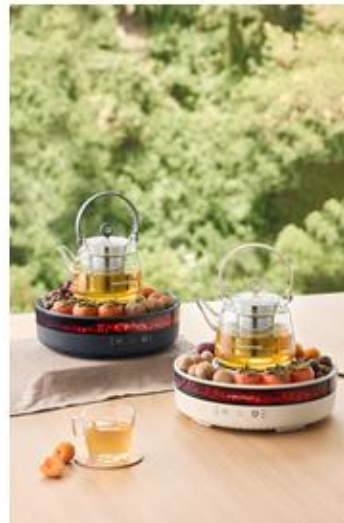
(2) Donlim (东菱)