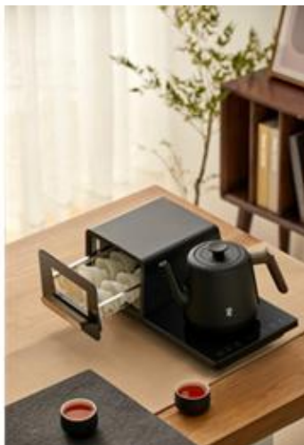
(4) Barsetto (百胜图)